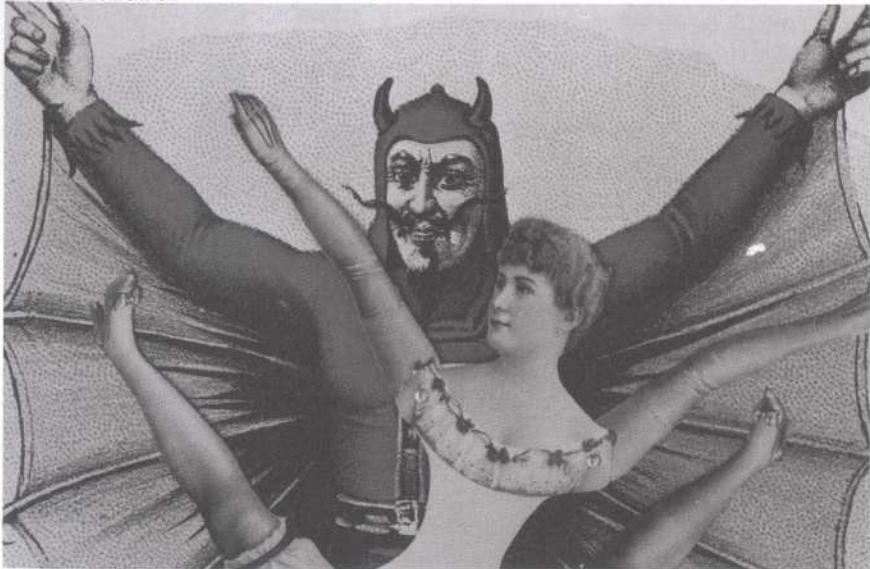
THE VISIBLE COMPENDIUM

El protagonista, el poeta Michael McClure, aparece reflejado en los cristales de una tienda y las ventanillas de un coche, así como en botellas, espejos, etc, es decir, en escenas que son, además, fieles retratos tanto de McClure como de la ciudad de San Francisco en 1957.